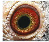
"Augusta" 07107-13-604 W