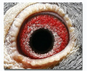
"Last Son" 07273-12-1240